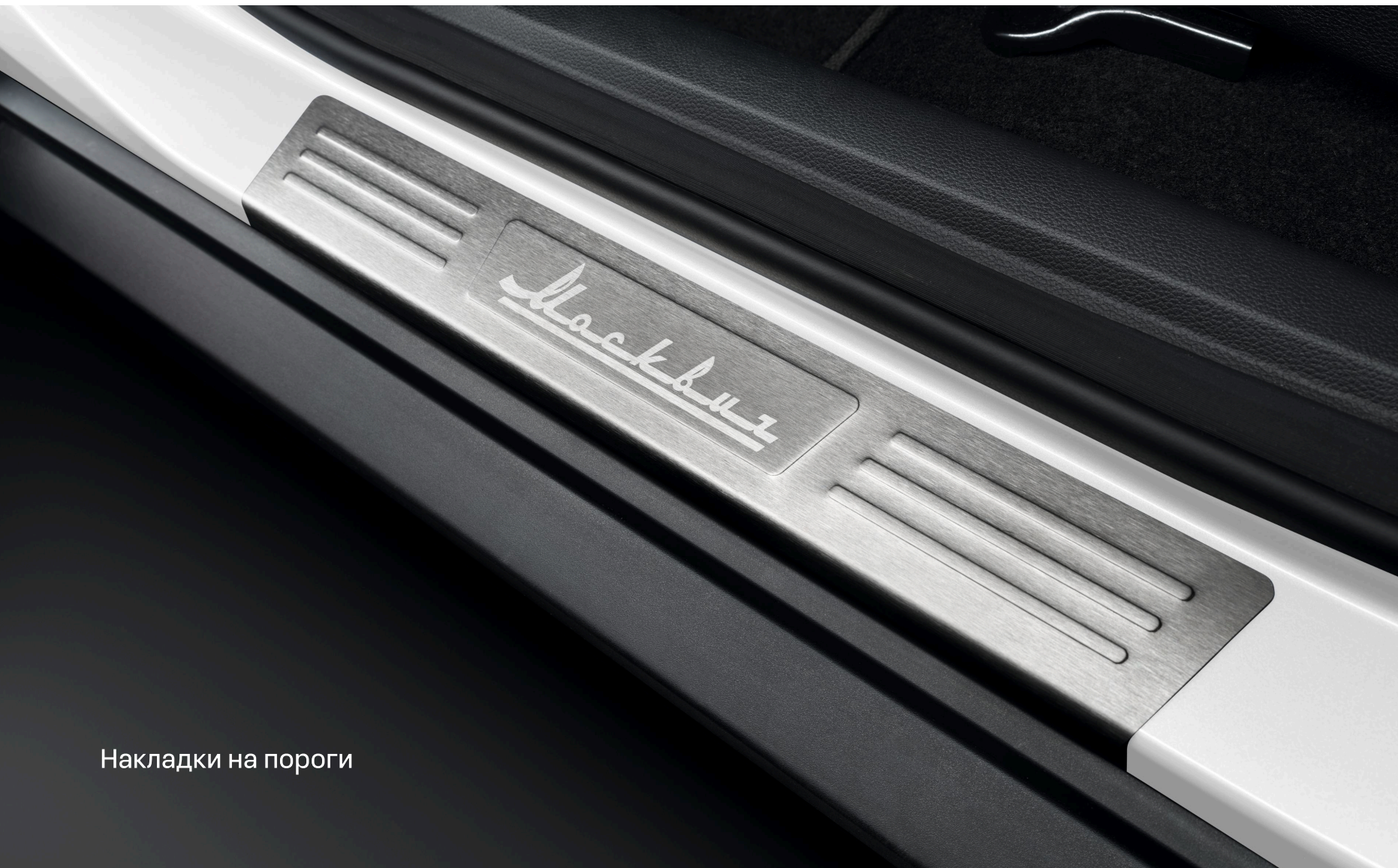
Накладки на пороги

Фирменные аксессуары сделают ваш Москвич еще более стильным и практичным, а ваша поездка станет намного комфортнее.